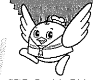
鳥取県マスコットキャラクター「トリビー」